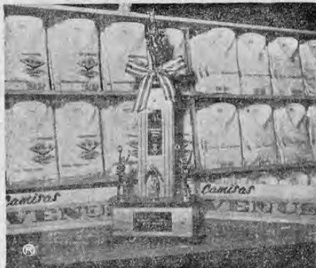
TROFEO VENUS: Este es el precioso trofeo que estará en disputa en la primera triangular internacional de fútbol. ¿Qué equipo se lo llevará para sus vitrinas? ¿Será para el campeón Sporting? ¿Será el vicecampeón Alajuelense? ¿O se lo llevarán los húngaros del Vasas?

11 horas.—ALAJUELENSE vs. DEPORTIVO SAPRISSA Arbitro: Juan Soto Paris.