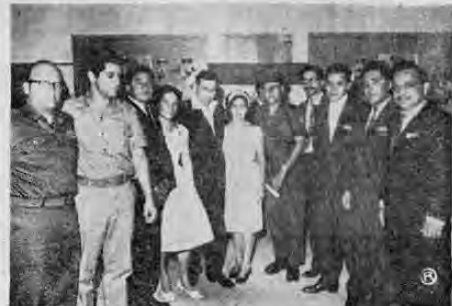
Acompañados por varios instructores y dirigentes del curso de Adiestramiento Juvenil aparecen en la foto insertada los costarricenses becados.