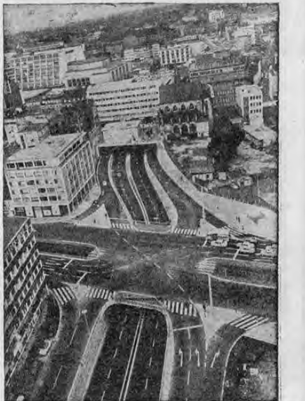
UNA MODERNA CALLE DE CIRCULACION RAPIDA atraviesa ahora el centro de Colonia. Su doble pista conduce desde el Puente de Sierri a la Plaza de Ofenbach. Esta calle norte-sur, de una longitud de 3.2 kms. de los que actualmente están abiertos al tráfico 1.6 kms. está destinada a absorber el tráfico del centro de la ciudad y aliviar la circulación de las calles paralelas. Los previsores urbanistas de Colonia han trazado esta autopista de cuatro calzadas por debajo de las dos importantes avenidas este-oeste (foto). Los aficionados al teatro y a la música se beneficiarán especialmente de esta nueva calle norte-sur, pues ella llega describiendo una elegante curva al centro cultural de Colonia donde están los modernos edificios de la Comedia y de la Opera (en el fondo a la izquierda).